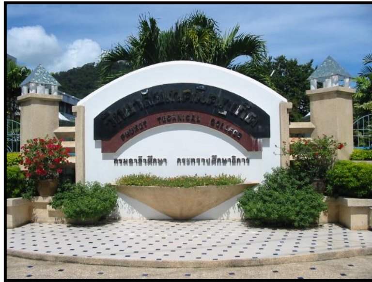
ป้ายวิทยาลัยเทคนิคภูเก็ต