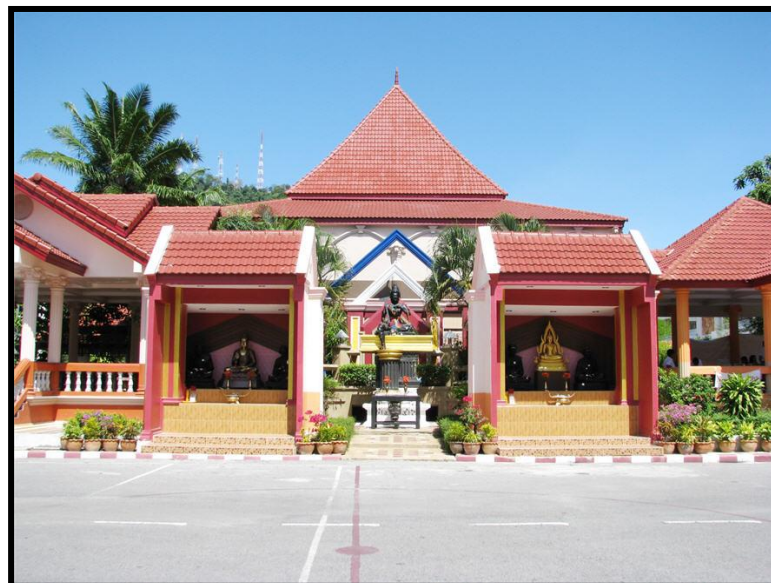
บริเวณลานหลวงปู่และพระวิชฌุกรม